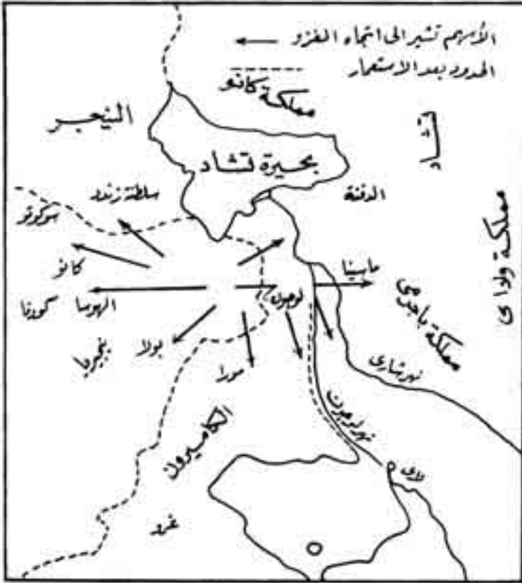
شكل رقم (12)

مربع، وتضم أكثر من خمسة ملايين نسمة (3) .