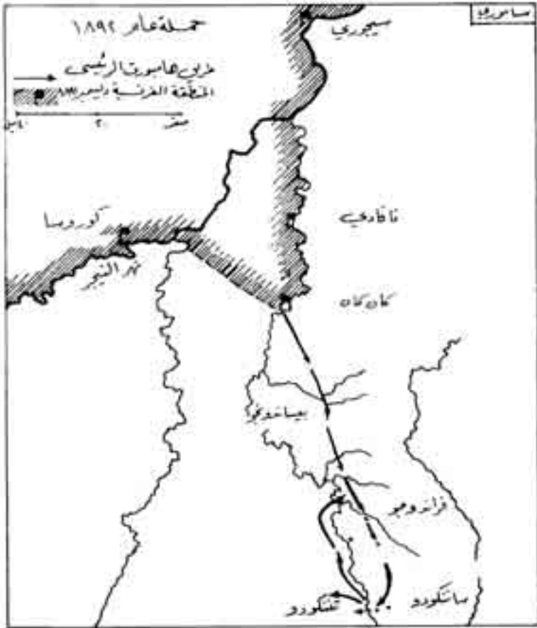
شكل رقم (11)

الذين يكونون له كل عدا، فقرر الابتعاد عن سيطرة الأوروبيين حتى يعيد تشكيل قواته، ويضيف إليها دماء جديدة قادرة على مواجهة هذا الحشد الضخم من الفرنسيين (2).