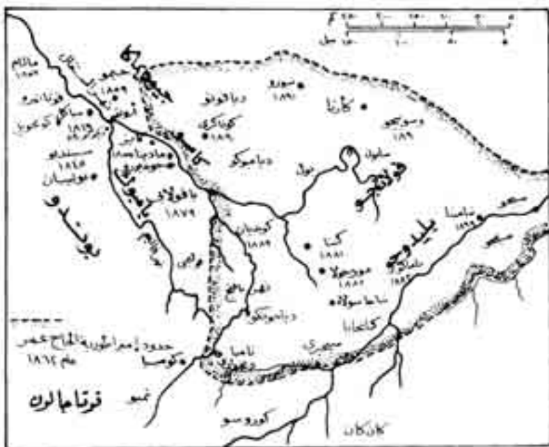
شكل رقم (6)

غزو ماسينا بسبب المجاعة، لكنه عاد وارتفع إلى 30000 جندي عام 1861. وفي عام 1852 أعلن الحاج عمر الجهاد ضد الوثنيين في السودان الغربي، واستطاع في خلال عشر سنوات أن يسيطر على كل السودان الغربي من حدود مدينة تمبكت حتى حدود السنغال الفرنسية، ورغم أنه اعتبر نفسه مصلحاً دينياً، وأعلن الزهد في الأمور الدنيوية المؤقتة إلا أنه كان مستعداً لتحقيق آماله من خلال الطرائق السياسية والعسكرية. واعتبر الحاج عمر أن رسالته المقدسة هي تنقية الإسلام في السودان الغربي من كل ما علق به من شوائب، ووضع حد للوثنية، وتطبيق الشريعة الإسلامية. ومن هنا وضع نفسه على رأس دولة إسلامية. واتبع أسلوب العنف في تحويل الناس الوثنيين إلى الشريعة الإسلامية. وقام ببناء المساجد ونشر المدارس القرآنية في كل أرجاء المنطقة التي امتدت إليهما حركته الإصلاحية. (1)