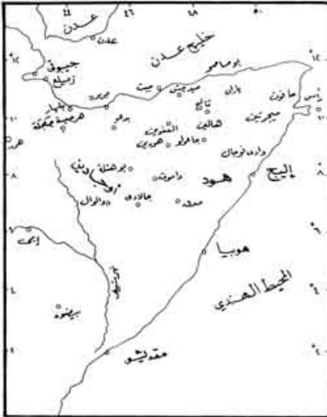
شكل رقم (13)

الصوماليين يقدر بحوالي خمسمائة فارس بقيادة موسى فارح من هود . وأما قوات المجاهدين فقد تمركزت في إقليم بارن وتقدر بحوالي ثلاثة آلاف مقاتل، واتجهت هذه القوة قبل الاشتباكات نحو الجنوب، ووصل سواين إلى بوهوتلي، وأقام بعض الحصون هناك لحماية آبار المياه ومخازن التموين، واستقر أخيرا في أريجو شمال منطقة مدق (2)(Mudug). وفي 20 يولييه عام 1902 بدأت القوات البريطانية هجومها على جيروى (Gherouey) بهدف تطهير ساحل الصومال من الدراويش، ومع نهاية أغسطس وصلت القوات البريطانية إلى جاعولو (3)(Gaolo).