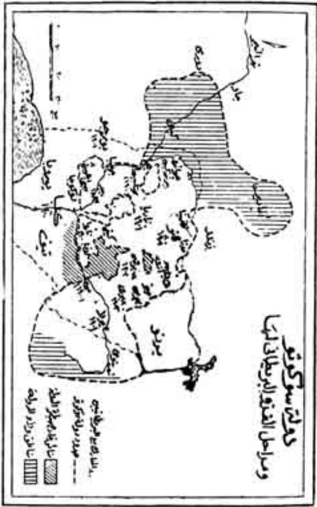
الشكل رقم (5)

الذهاب إلى سوكتو بالجزية السنوية من المرور في أرضه. كل هذه الأسباب أعطت مبررا للبريطانيين لغزو إمارة زاريا الإسلامية هذا في الوقت الذي أتاحت الإمارة ذاتها الفرصة للبريطانيين عندما استجبت بهم للقضاء على أمير كونتاجورا الذي كان يغير على قرى الإمارة.