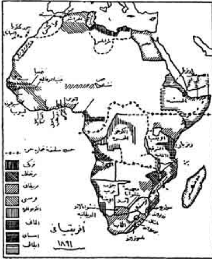
الشكل رقم (4)

سقوط هذه الخلافة في أيدي البريطانيين في عام 1903 (1).