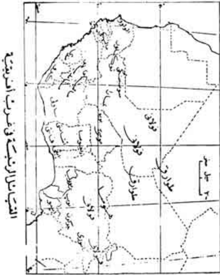
شكل رقم (14)