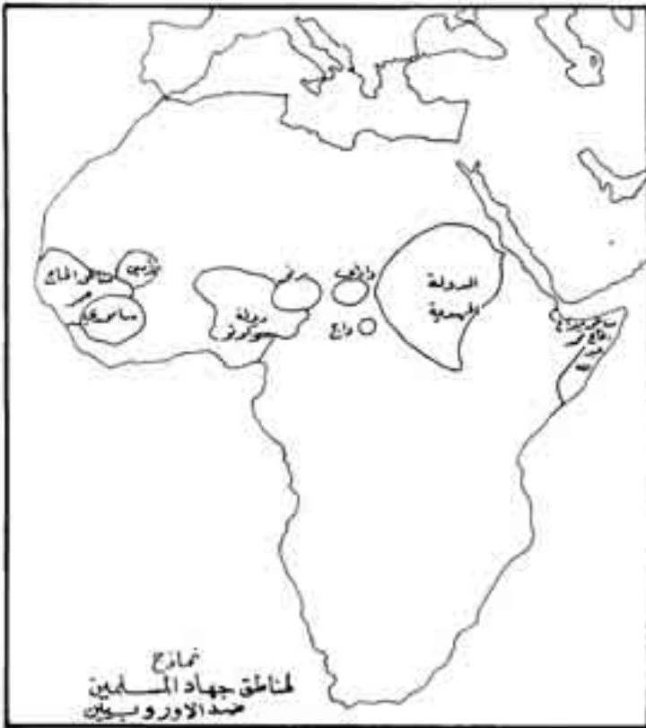
شكل رقم (14)