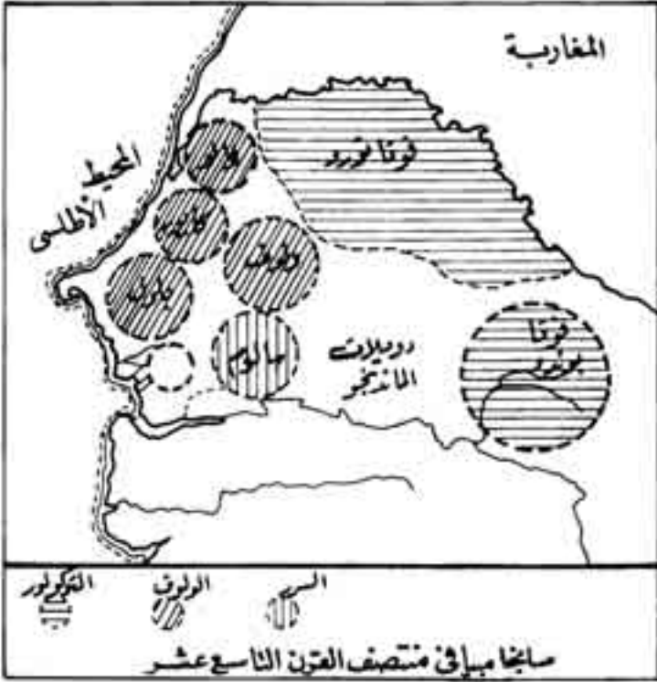
شكل رقم (9)