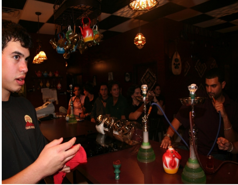
جانب من الزبائن في إحدى ليالي كافيه شيشا 2006