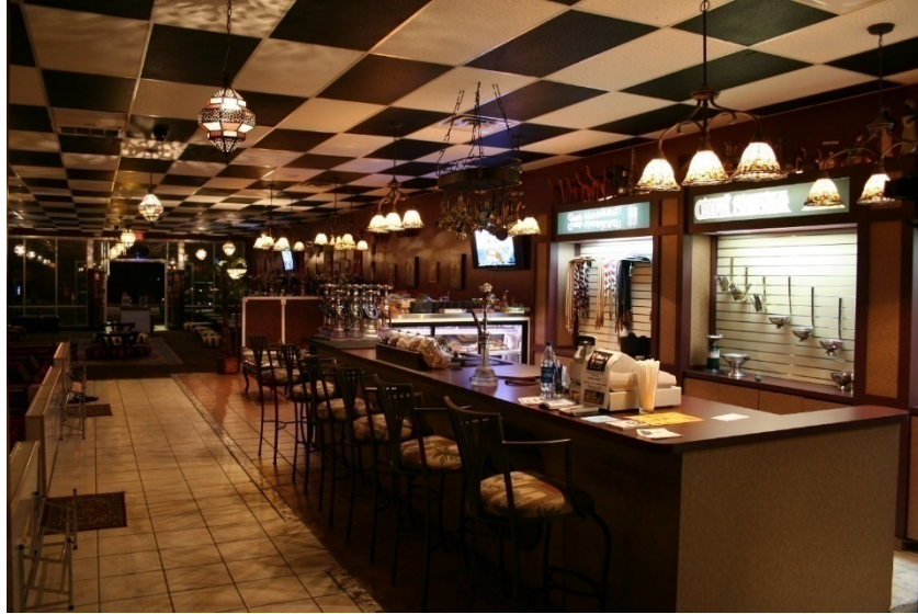
كافيه شيشه (القهوه): تالاهاسي، فلوريدا، 2006