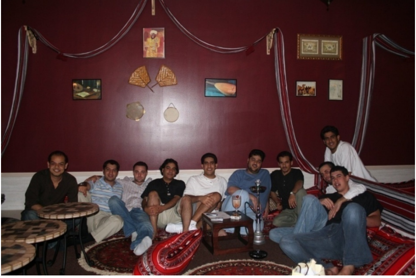
صوره جماعيه للطلبه الخليجين والعرب المبتعثين 2006