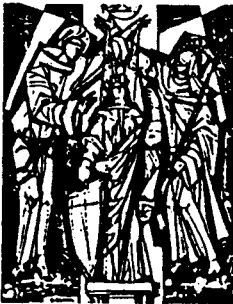
1530-1800 S. FRANCESCO D'ASSISI & CATERINA DA SIENA PATRONI D'ITALIA

Il est défendu de joindre n'importe quel objet à l'envoi sans en déclarer la nature et le poids