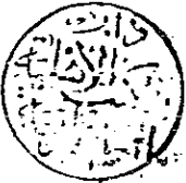
صورة عنوان المخطوط

حُرِّمَتْ حَتَّى مِنْ الزُّهْدِ وَالرَّقَائِقِ مَالِ الْإِمَامِ الْخَافِظِ أَبِي بَكْرٍ لِحَدِيثِ عَلِيِّ بْنِ أَبِي طَالِبٍ رَوَاهُ الْعَامِي أَبُو بَكْرٍ مُحَمَّدٌ بْنُ عَبْدِ اللَّهِ بْنِ مُحَمَّدٍ النَّصَائِيُّ عَنْهُ وَعَنْهُ التَّبِيعَانِ الْخَافِظُ أَبُو أَحْمَدَ عَبْدُ الْوَهَّابُ بْنُ عَلِيِّ بْنِ عَلِيِّ بْنِ عَبْدِ اللَّهِ الْأَسَدِيِّ وَأَبُو مُحَمَّدٍ عَبْدُ الْعَزِيزِ بْنُ مُحَمَّدٍ بْنِ غَنِيْمَةَ بْنِ حَنْبَلَةَ الْأَشْجَبَانِيَّ سَيِّدَ عَالَمِيهَا وَعَمَّا سَمِعَ الْإِمَامُ الْخَافِظُ حَالَ الْمَرْحُومِ مُحَمَّدِ بْنِ مُسَدِّقِ بْنِ أَبِيهِ اللَّهُ بِبَطْنَةِ وَسَمِعَ عَلَيْهِ السَّلَامُ أَبِي الْحَسَنِ عَلِيَّ بْنَ الْحُسَيْنِ بْنِ عَلِيِّ بْنِ مَهْزُورٍ عَمِّي أَبِي الْحَسَنِ الْفَصْلُ فِي سَهْلِ بْنِ يَسْرَةَ الْكَنْبِ عَنْ أَبِي بَكْرٍ الْخَافِظِ سَمِعَ صَاحِبَهُ عَبْدَ اللَّهِ بْنَ مُحَمَّدِ بْنِ مُحَمَّدِ بْنِ أَبِي بَكْرٍ الطَّبْرِيِّ الْمَكِّيَّ الشَّافِعِيَّ