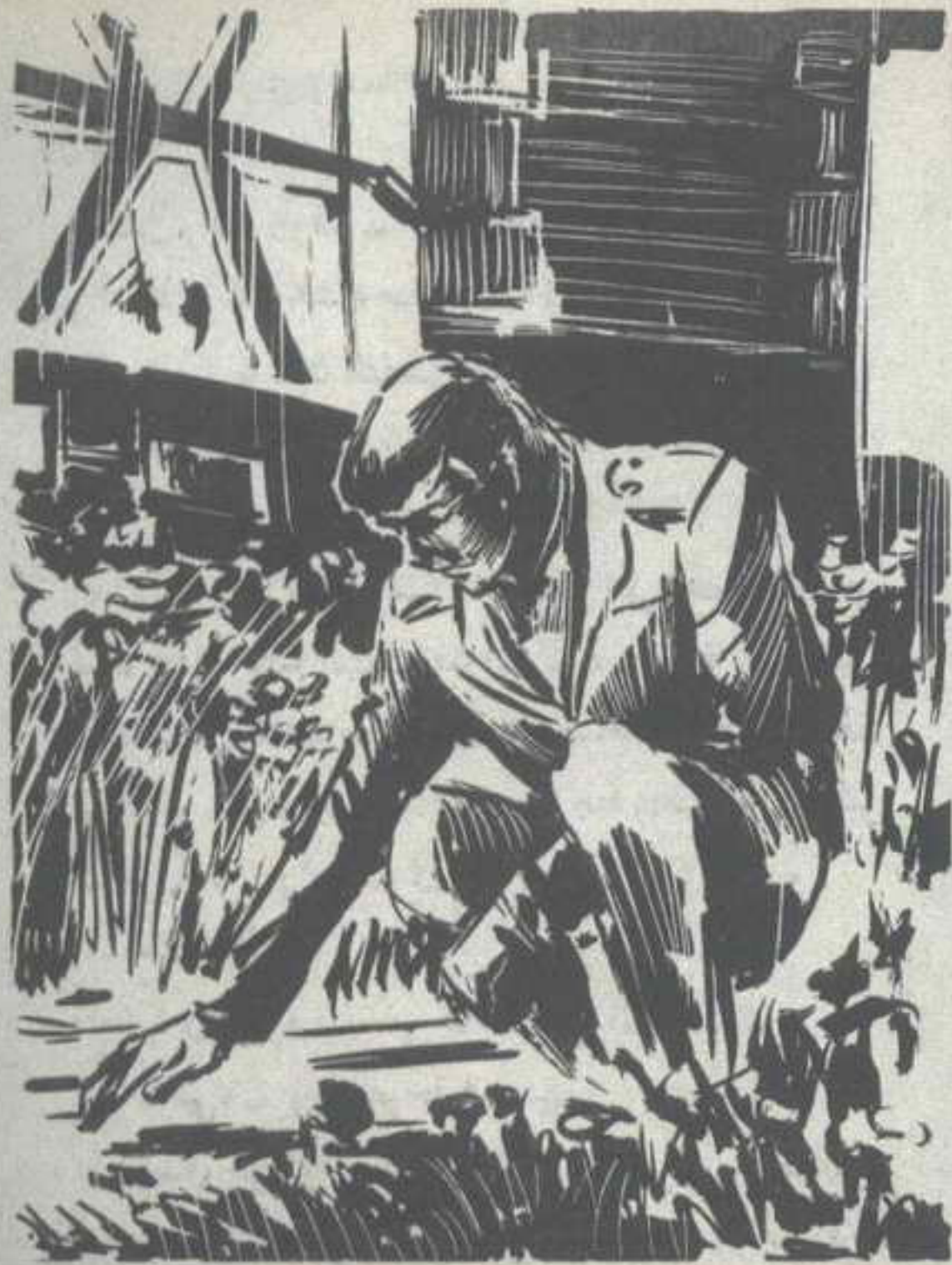
واتجه نحو النافذة ، وانحنى يفحص الأرض الملاصقة لها ..

وجه مألوف ، تتطلع عيناه إلى داخل المنزل ، من خلف زجاج النافذة ..