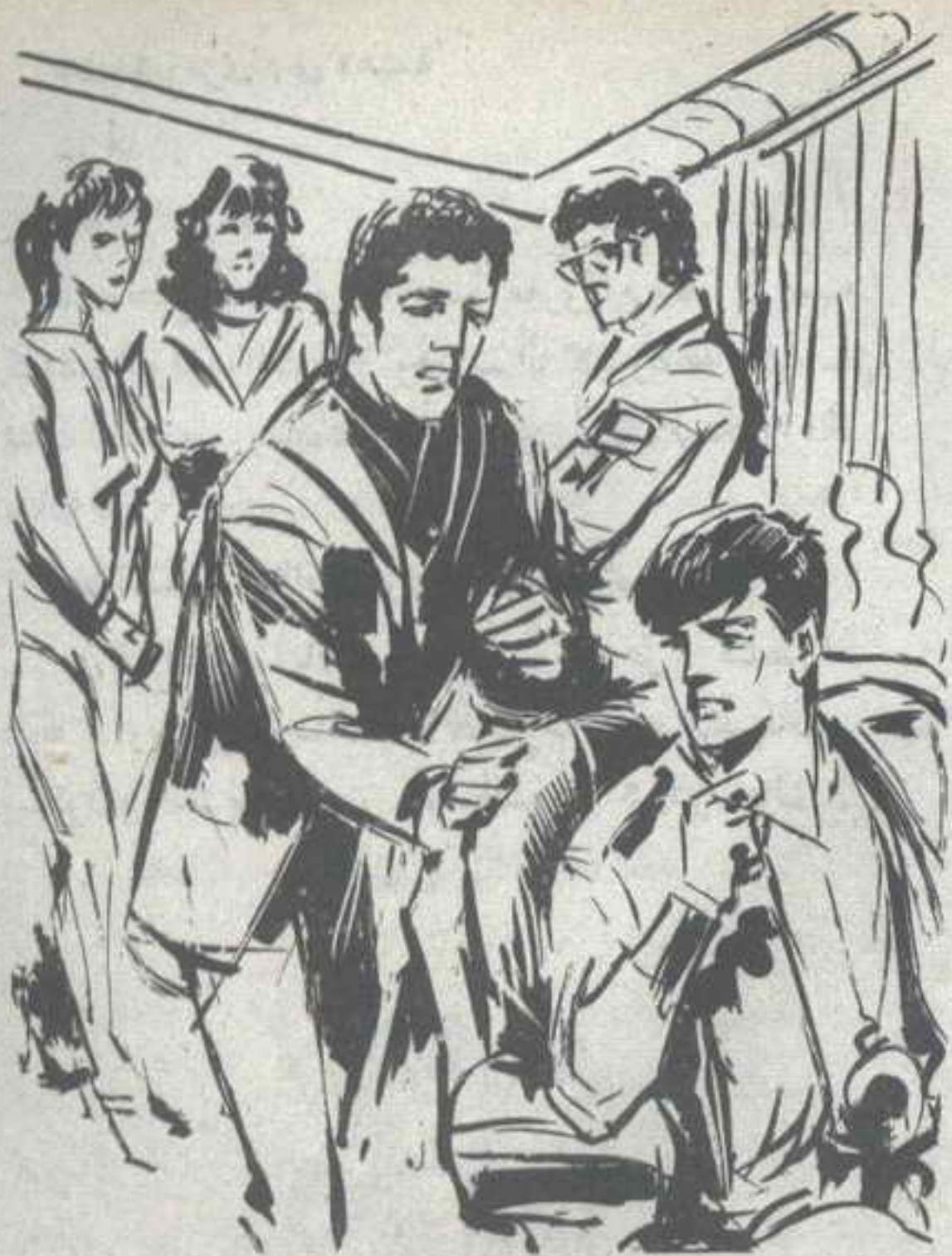
تنهد ( نور ) في عمق ، وقال : — ما من وسيلة أخرى يا ( رمزي ) ؟