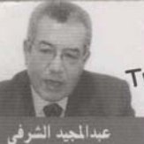
عبد المجيد الشرفي