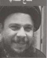
محمد باقر الصدر