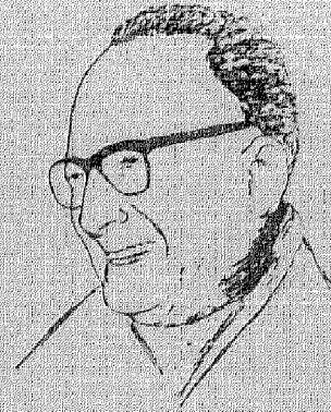
مالك بن نبي

ولد عام ١٩٠٥ في مدينة قسنطينة في الجزائر .