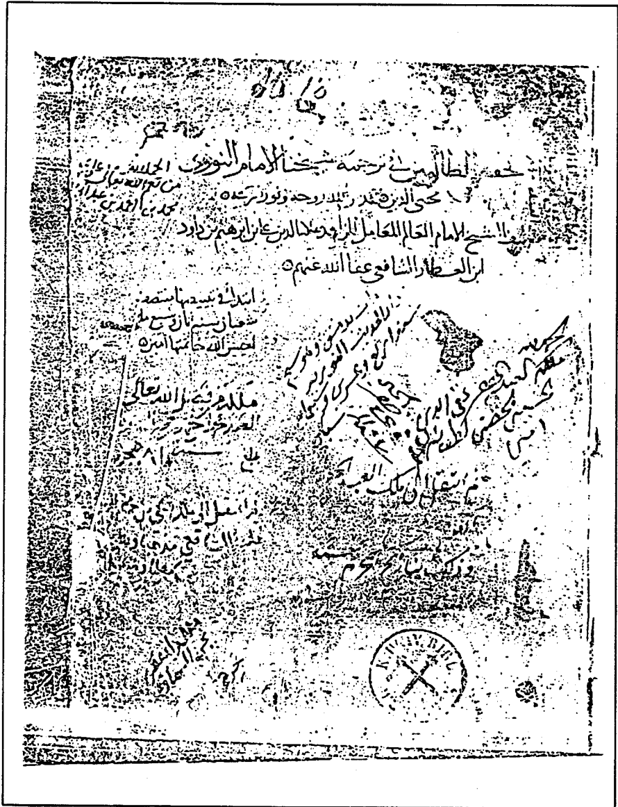
صورة عن طرة النسخة المعتمدة في التحقيق