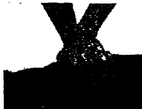
طريقة التدليك الخارجي للقلب