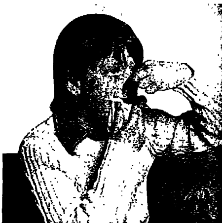
كيفية وقف النزف من الأنف بالضغط