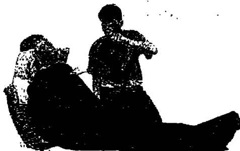
التبريد بالياه في حالة ضربة الشمس