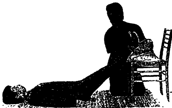
استعادة تدفق الدم للمخ في حالات الهبوط والصدمة