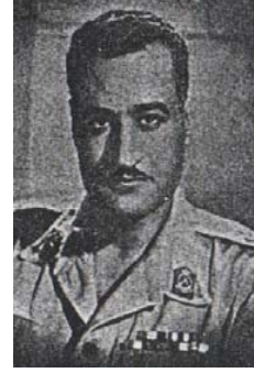
جمال عبد الناصر