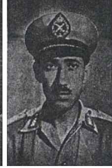
عبد الحكيم عامر