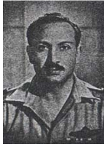
عبد اللطيف البغدادي