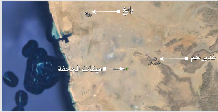
صورة جوية يظهر فيها غدير خم والجحفة