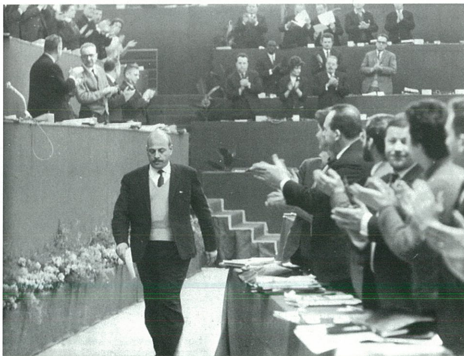
المؤتمر ١٨ للحزب الشيوعي الفرنسي