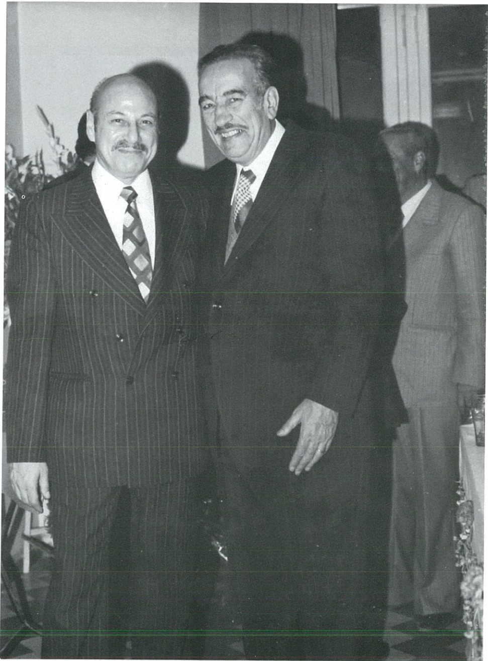
خالد بكداش ويوسف الفيصل