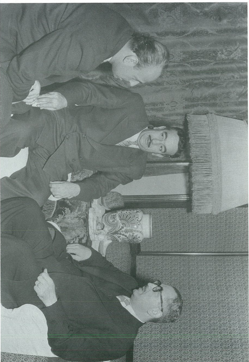
نتولا شاوي - خالد بكداش - يوسف فيصل في موسكو عام ١٩٥٦