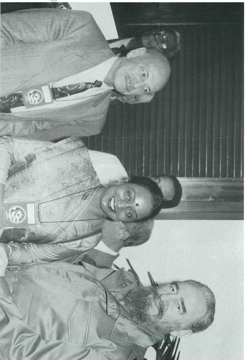
مؤتمر القارات الثلاث في كويا